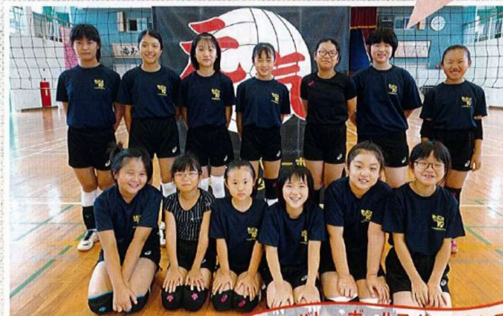
社北Jr.バレーボールスポーツ少年団