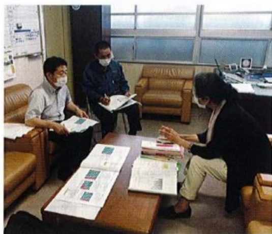
第二波に向けてPTA会長、副会長、校長先生の話合いの様子

音楽の授業で使用するリコーダーや鍵盤ハーモニカは息を吹くことが出来ないため、PTAより電子ピアノ15台と五線譜マグネットシートを購入させて頂きました。